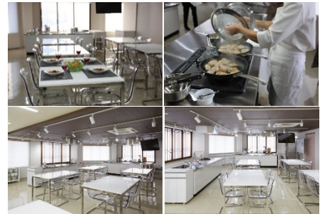
在築地の自社厨房