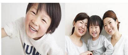
为了未来的孩子们