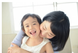
培育富有爱心的心灵